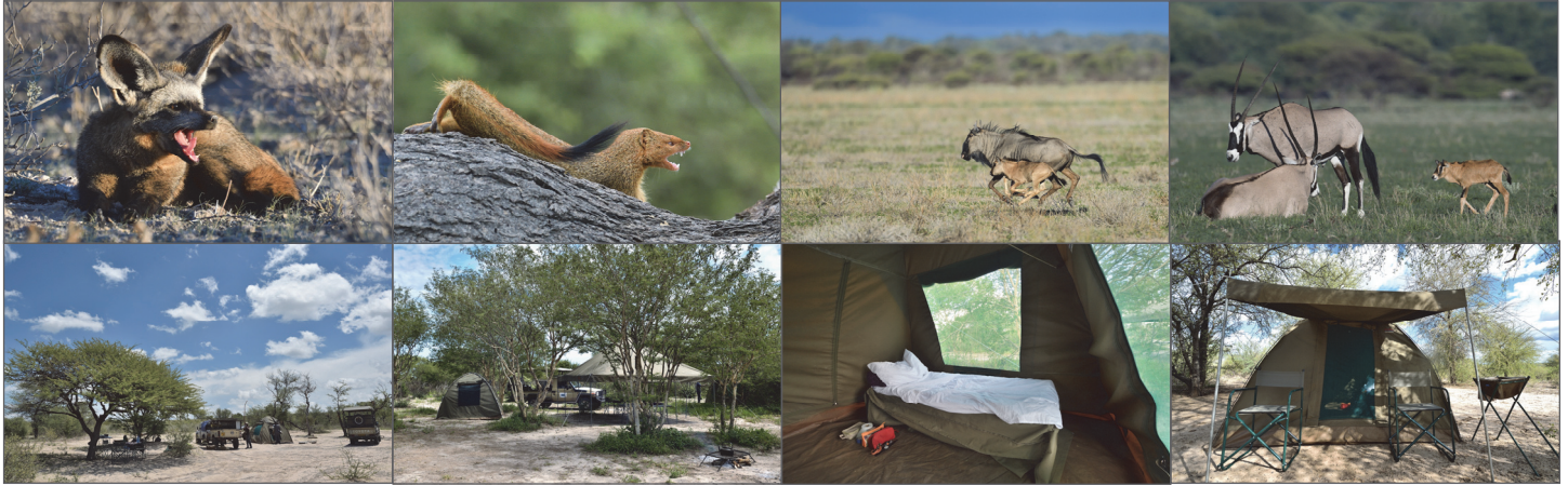
Le camp est monté pour 2 ou 3 nuits. Chaque participant dispose de sa propre tente équipée d'un lit de camp, toilettes, et douche.